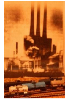
Zona industrial, cisternes de fueloil. Paisatge amarg.